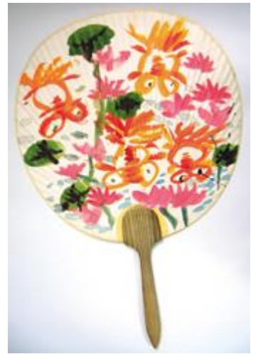
一名有癲癇的小二學生創作品

「當我醒來.....只感到恐懼和迷惘，對剛發生的事印象十分模糊，而周圍的人都表現得十分驚駭。後來醫生告訴我，原來我是全身「癲癇發作」，期間我昏倒在地，四肢痙攣抽搐，情況持續了數分鐘。當我再次有知覺時，感到非常頭痛，筋疲力盡，很想睡覺。我究竟有什麼問題？」